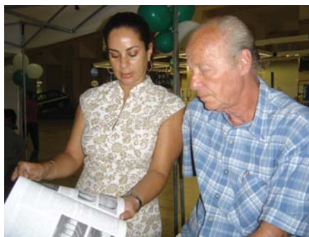
Funcionária da Clínica Especial dando orientações no stand da Coopangio