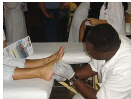
Podólogo da Clínica Especial - Clínica de Cuidados com os Pés prestando atendimento no stand da Coopangio