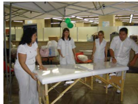
Montagem do stand da Coopangio pelos podólogos

da entidade: "Acho que agora, nossa Coopangio começará a ter mais visibilidade. Este tipo de evento deveria se repetir em outros locais.