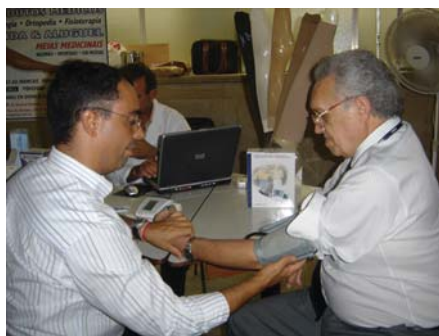
Funcionário da Med Shop fazendo aferição da pressão em um servidor

no evento: "A importância da Coopangio numa feira como essa é permitir à população o acesso a informações sobre as especialidades, dando a oportunidade dela se beneficiar com o atendimento de médicos preparados, portadores de títulos nesta especialidade. A população passa a