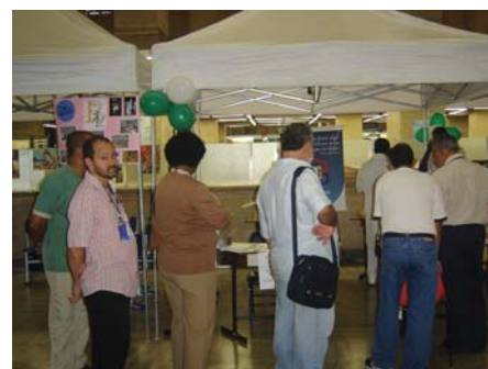
Fila para o teste de glicemia capilar no stand da Coopangio

Na feira, o atendimento da Coopangio foi gratuito, assim como todas as parcerias estabelecidas para o evento.