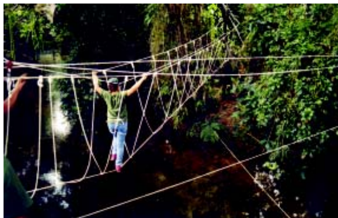
Travessia de ponte

Iniiciando as atividades científicas de 2003, teremos nossa primeira reunião fora de sede, na cidade de Silva Jardim. Em julho de 1999 estivemos lá e foi um grande sucesso. Para a versão 2003 está programada a chegada ao Afetiva Hotel Fazenda pela manhã, no sábado 22/02, e recepção com café da manhã rural (bolo de milho, bolo de aipim, etc.)