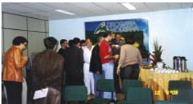
Hora do lanche